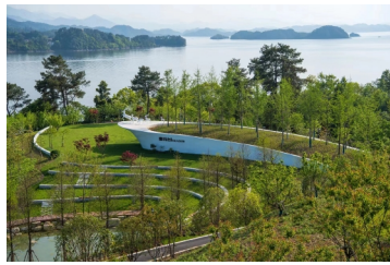
空中观景平台眺望千岛湖

千岛湖植物园书写了生态优先、绿色发展的新篇章，也承载着淳安人民生态美富、深绿兴富的新向往。新起点、新征程，淳安县将进一步丰富植物品类，美化园区环境，优化生态布局，加快把千岛湖植物园打造成为休闲观光的新地标、“两山”转化的示范点。