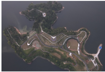
植物园建设前的清心岛

两年前，这里还是千岛湖临湖整治点之一。由于经济开发建设，清心岛东部有过半面积的区域地形破损，水土流失，生物多样性在一定程度上遭到破坏。