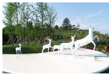
植物园中的“鹿鸣台”

融植物科普教育于一体的游览点，设置有天空之境、婚礼草坪、紫藤隧道、垂樱小院等特色景观，是一座集植物保护、科普研学、观光休闲、产品展示等为一体的综合性植物园。