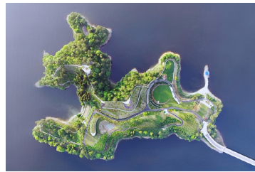
植物园建设后的清心岛

淳安县规划和自然资源局相关负责人表示，我们通过科学规划岛屿功能布局、基于自然的原位修复技术、人文元素有机融入、科研科普有效结合、构建低影响开发雨水系统等举措，并运用微生物修复、土壤动物修复等先进适宜的技术开展生态修复，极大地改善了岛上的生态环境，林分结构更加复杂，生物多样性显著提